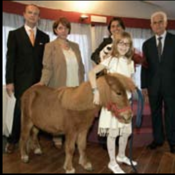
< Premiazione 2005