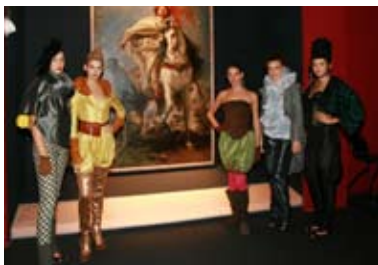
Gli abiti dell'Accademia Koefia