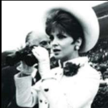
< Gina Lollobrigida spettatrice alle Capannelle