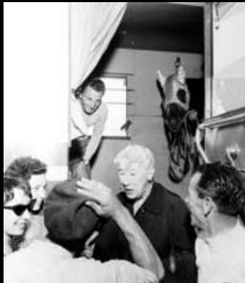
< Rientro a casa per Ribot dopo la vittoria dell'Arc