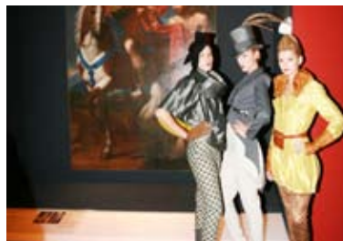
Le modelle dell'accademia Koefia