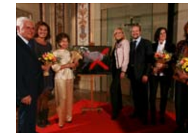
Foto gruppo premiazione